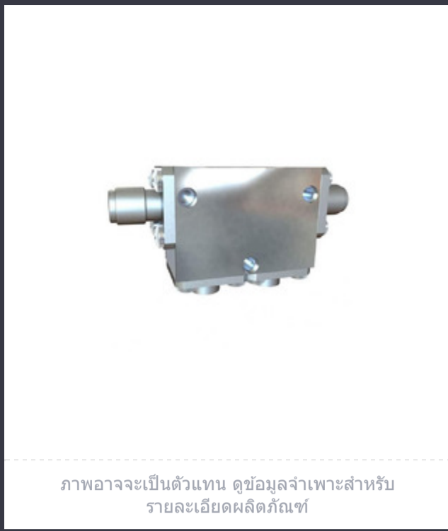
ภาพอาจจะเป็นตัวแทน ดูข้อมูลจำเพาะสำหรับรายละเอียดผลิตภัณฑ์